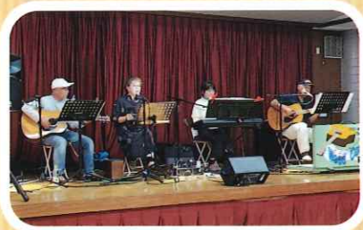
坂井支部 「Wood Company」コンサート