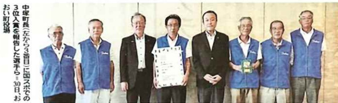
中飯町長（左から2番目）に国スポの3位入賞を報喜した選手ら。30日のお祝い収録

そんなGG生活であるが、練習の成果というか「運」というか、この9月、佐賀県で開催された国民スポーツ大会に福井県代表として出場できた。結果は見事団体3位入賞。一生の思い出になった。新聞でも報道され、たくさんの人に「すごい！おめでとう」と言ってもらえた。今さらながらに地域で「つながり合う」活動の大切さ、有難さを感じた。良いことずくめの競技である。