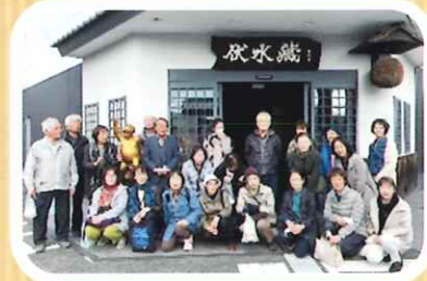
福井支部 研修旅行「黄桜伏水蔵」