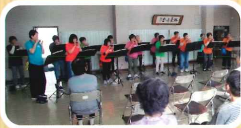
大野支部 オカリナ演奏鑑賞会