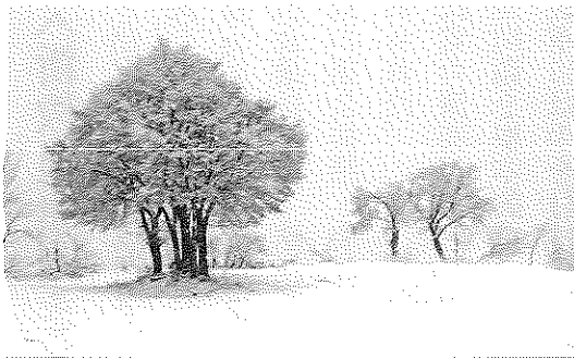
写真「なごり雪」 若山文雄さん (南魚支部)

6p 能登半島地震の対応 ミニ情報 7p みんなの広場 (山上オクラ、今井真悟、佐久間節子)