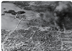
10・10空襲時の那覇港および旧那覇市街 1944年10月10日