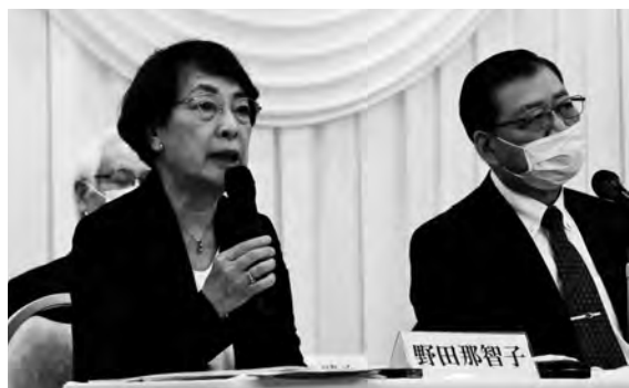
人見会長（右）と野田事務局長