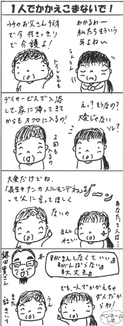
*前号は小さすぎて読めませんでした。再掲します。

◆全国スーパーマーケット協会主催の「お弁当・お惣菜大賞2021」で、新発田市「北弁（ほくべん）」の「さくらたろう元祖きつね餃子」（1本750円）が中華点心部門で、三条市「あづみ家」の「Gorge ou 麩（ゴージャフ）」（1パック500円）が惣菜部門で、それぞれ最優秀賞を受賞。