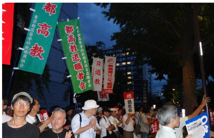
8月6日 木曜日行動 衆議院第2議員会館前(PM7時)

「連休を越せば世論は沈静化する」という政府・与党の目論見は外れました。新聞各社の調査でも安倍政権の支持率が激減。7.26 国会包囲行動には約 2 万 5000 人、7.28 日比谷大集会には約 15000 人も市民が参