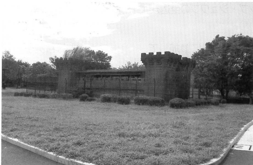
「小松川閘門」部分(江東区「大島小松川公園・風の広場」)

千代田区一ツ橋2-6-2 都高教内 HP: tokokyotaisyoku.dokkoisho.com