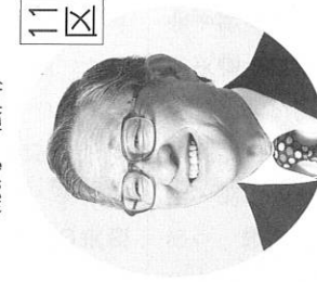
みつなご 夫 (十勝)