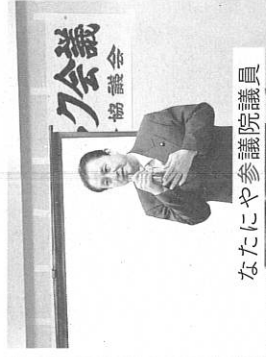
なたにや参議院議員