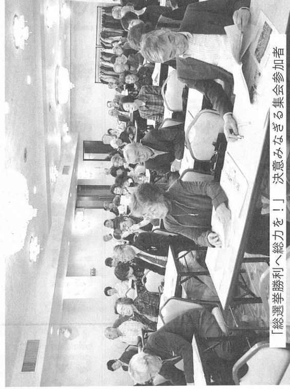
「総選挙勝利へ総力を!!」決意みなぎる集参加者