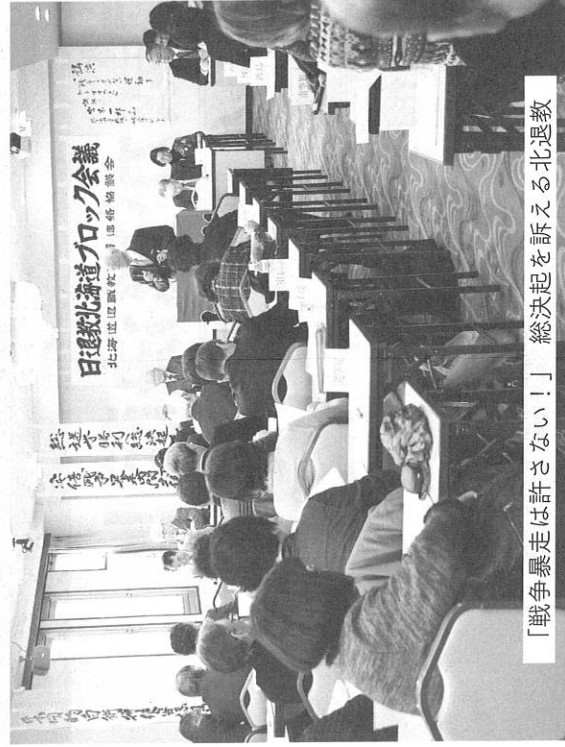
「戦争暴走は許さない!!」総決起を訴える北退教