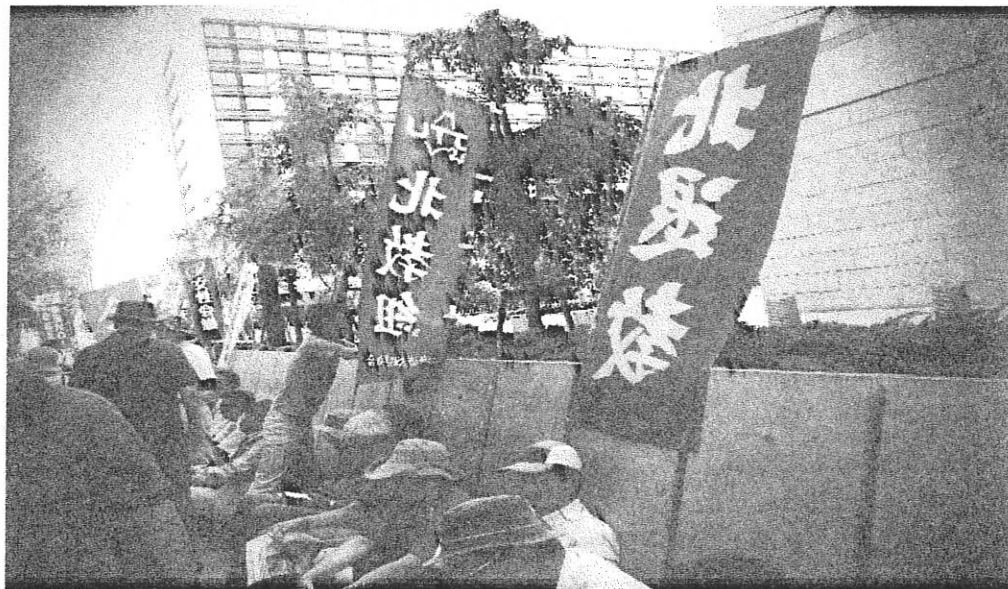
国会前に座り込む北退教（「北教」北退教版7・8参照）6月24日

いよいよ闘いは正念場です！ 全力を挙げ教え子を戦場に送 らないため頑張りましょう！