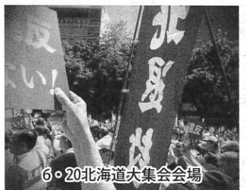
6・20北海道大集会会場