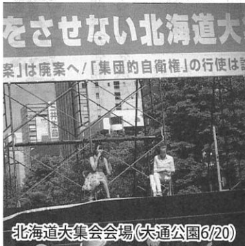
北海道大集会会場(大通公園6/20)