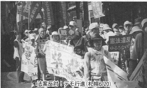
法案反対!デモ行進(札幌6/20)