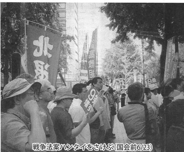
戦争法案ハンタイをさげぶ(国会前6/23)