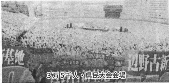
3万5千人・県民大会会場