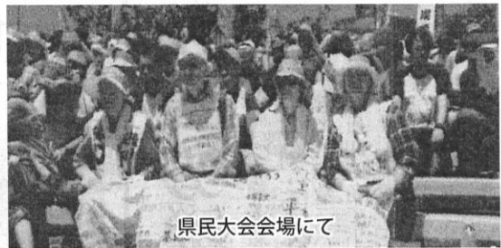
県民大会会場にて