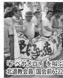
「アベヤマト回!」を叫ぶ北退教会員(国会前6/22)

国会が長びけば長びく程うそでかためた法案はボロがる。今こそチャンス、正念場の闘いに全力をあげよう。国会周辺は一段と廃案への熱気に包まれた。