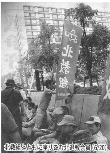
北教組とともに座りこみ北退教会員(6/20)

「戦争法案、いまずぐハイアン!」国会前のシュプレヒコールは一段と高まる。 北退教は北教組とともに六月十四日から九日間の国会前すわりこみと三万人の国会包囲行動に参加。網走、札幌、釧路、小樽からのべ十名が連日、法案廃案期延長反対を強く訴えました。六月二十日には「戦争させない北海道大集会」(五千五百人)に各退教から百名が参加、デモの先頭に立ちました。政府は高まる国民世論をおさえきれず、会期延長、法案強行の暴挙にでました。 いよいよ闘いは正念場を迎え、マスコミ弾圧の愚挙もあり一気に大きく盛りあがっています。教え子を戦場に送らないためとにもがんばりましょう!!