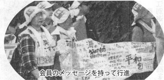
会員のメッセージを持って行進

日退教「沖繩と連帯する日退教行動」と道平和運動フォーラムの行動に南空知、中空知、石狩、札幌の各退教から九名が参加、「新基地阻止」で沖繩・全国の仲間と共闘を強めました。