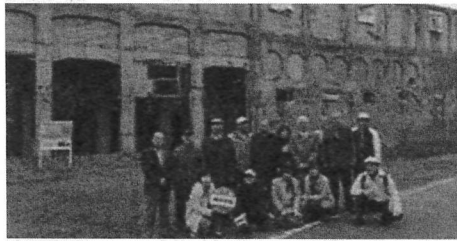
2プロ (留萌・旧羽幌炭鉱跡見学)