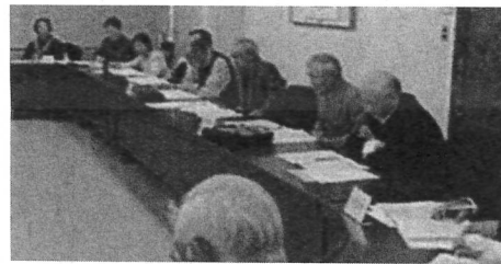
4プロ (日胆・空知合同の活動交流)

■二〇一四年度は九月二十五日の五プロ(北退教版十月号掲載)を皮切りに十月に四つのプロックで開催。どこも安倍政権