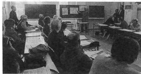
3プロ (函館・大間原発学習)