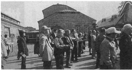
1プロ (後志・余市ウイスキー工場見学)