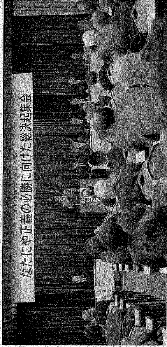
あなたにや正義の必勝に向けた総決起集会